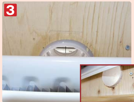
3 スリーブ管を付け