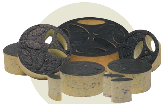
過大流量調整バット