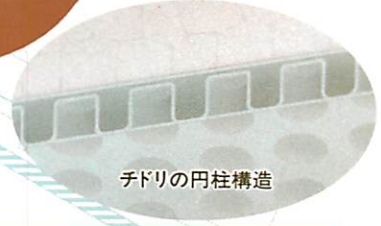
チドリの円柱構造